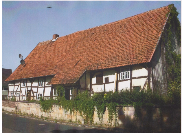
Der Brunottesche Hof in Wallenstedt, vor Beginn der Arbeiten.

Ausgangspunkt bildete ein unbewohntes Bauernhaus mit fehlender Standsicherheit und hohem Verwertungsdruck auf einer weitläufigen, innerörtlichen Hofstelle im Dorf Wallenstedt im von Schrumpfung stark betroffenen Leinebergland zwischen Hameln und Hildesheim. Das im September 2008 von der Denkmalfachbehörde dendrochronologisch auf 1594 datierte Baudenkmal, ein knapp 25 Meter langer, quer erschlossener Vierständer mit Kammerfach und Gewölbekeller nach Norden, Küchenluchten nach Westen und Osten, einem steilen Spitzsäulendachwerk mit Halbwaln nach Süden, einer Oberrähmverzimmerung und einer Rauchhausfunktion bis in das späte 19. Jahrhundert gilt es langfristig zu bewahren. Der Bau ist über die Region hinaus eine extrem seltene, hauskundliche Quelle für eine Übergangszone zwischen