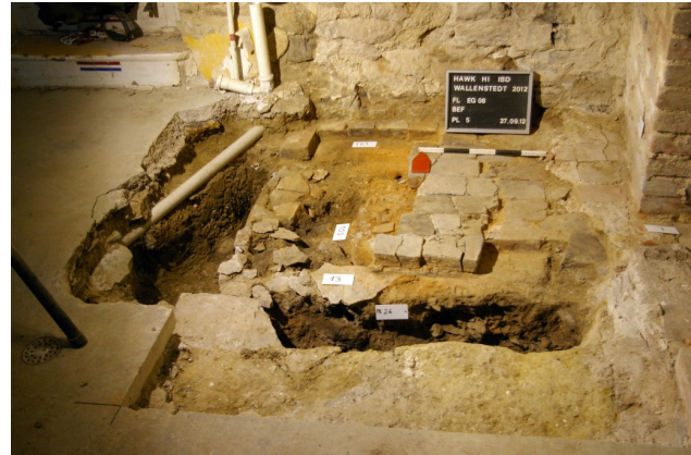
Die Herdstelle im Flett (Nutzungsschicht des 19.–20. Jh.).

Auch im Gewölbekeller konnten verschiedene