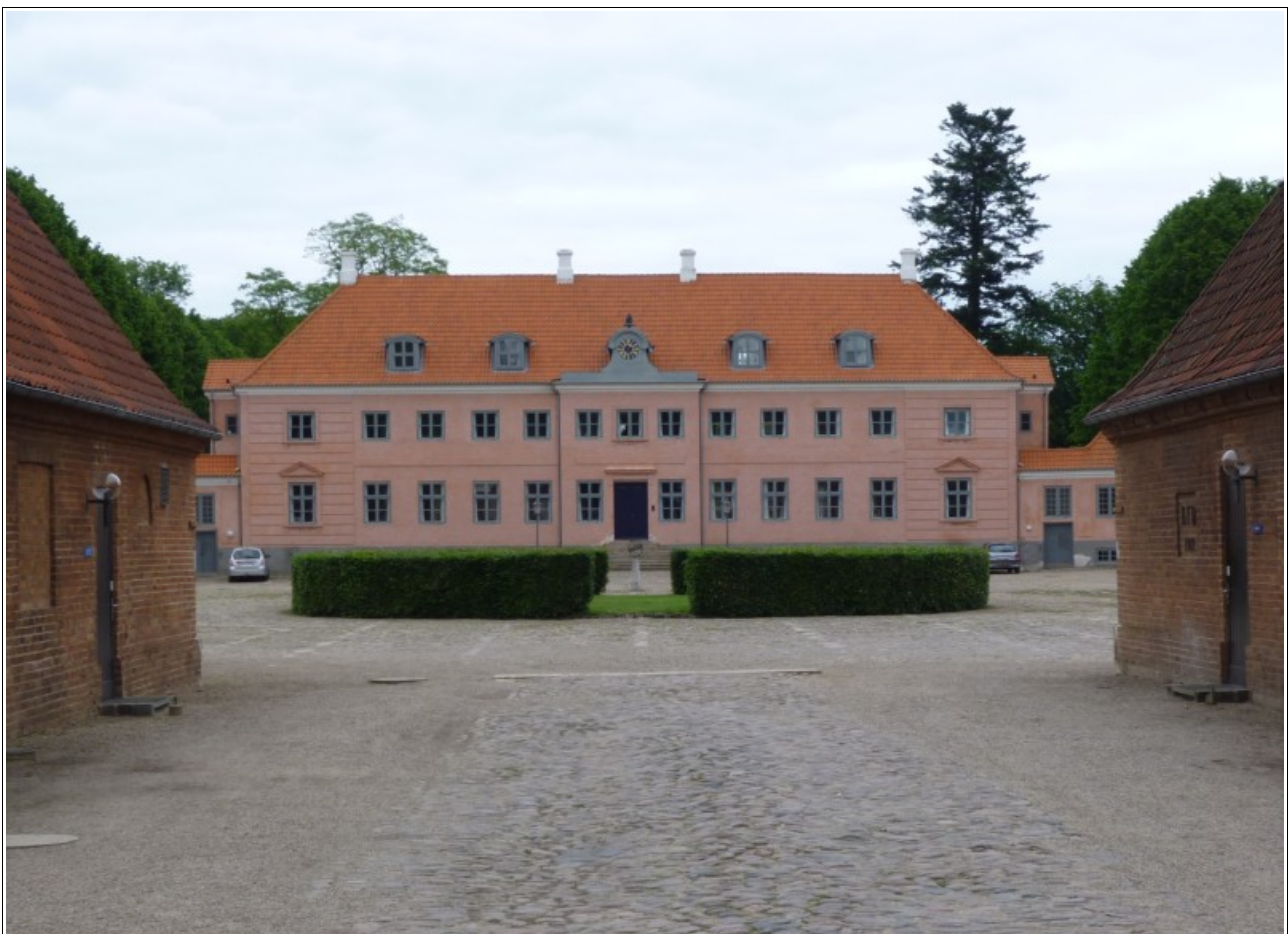
Ehem. Herrensitz Moesgård bei Aarhus. Hauptgebäude von 1778.